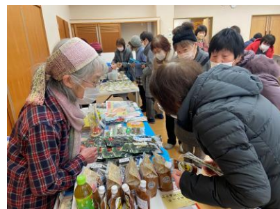
ふれあいマーケットの様子

2月7日(土)に飯伊地域のボランティアの皆さんが一堂に会する「令和7年度 飯伊ブロックボランティア交流研究集会」が福祉センターで開催されました。当日は多くの方にご参加いただき、本当にありがとうございました!