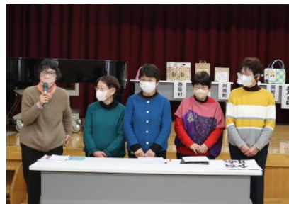
傾聴ボランティア「和」 (根羽村)