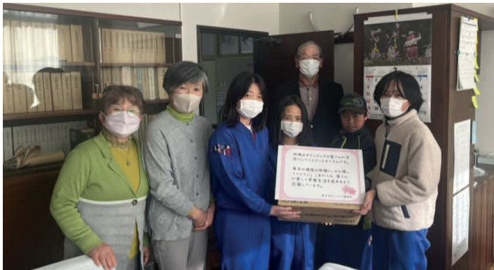
第二小学校 生徒会の生徒さんにお渡ししました。

地域の方々が手作りされた「ぞうきん」を村内3校へお渡ししました。多くの方にご協力いただきありがとうございます。