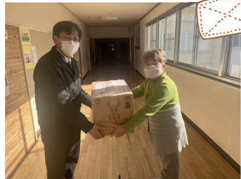
第一小学校 教頭先生へ

地域の皆様、雑巾作りやタオルの寄贈に温かいご協力をいただき、ありがとうございました。