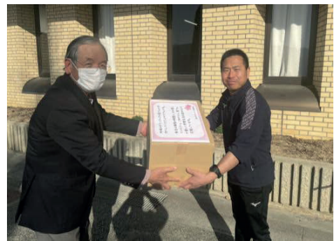
喬木中学校 教頭先生へ